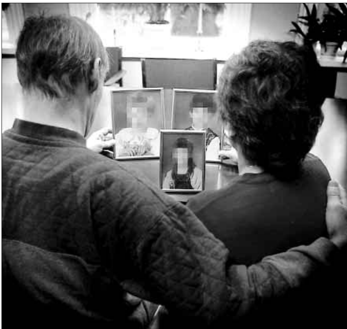
DERAS BREV STOPPADES. "Hälsar till Er så mycket från Era kompisar, dom väntar på Er." Så skrev Alma och Endre till sina omäändertagna barn. Men brevet stoppades av socialen. Läs brevet här intill och motiveringen från socialekreteraren.

”Hej på Er! Hoppas att allt är OK med Er, vi saknar Er så mycket. Tack för Era fina brev, hoppas att vi snart får träffa Er och att Ni får komma hem snart. Vad gör Ni för något på dagarna? Går ni i skolan? Och hur länge på dagarna. Hoppas att Ni kommer hem så att vi kan gå på den stora utställningen nästa månad om Ni är hemma. Det kommer flera av era kusiner från Tyskland hit snart och vill träffa Er, J, D och N, kanske någon mer. H och M kommer lite senare, slutet av september, han har köpt en jättefin keps till dig, X, som han skulle ge dig på lördagen men han fick ju inte komma. Vi kan skicka pengar till Er men vi vet ju inte om Ni får dom, vi ska se hur