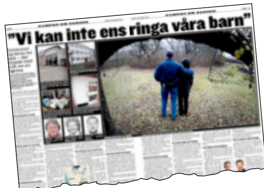
GT den 9 november.