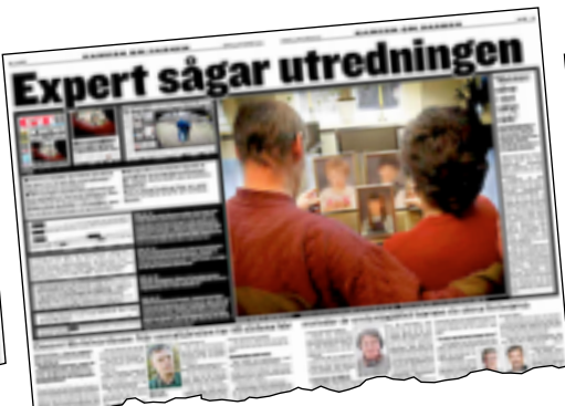
GT den 10 november.