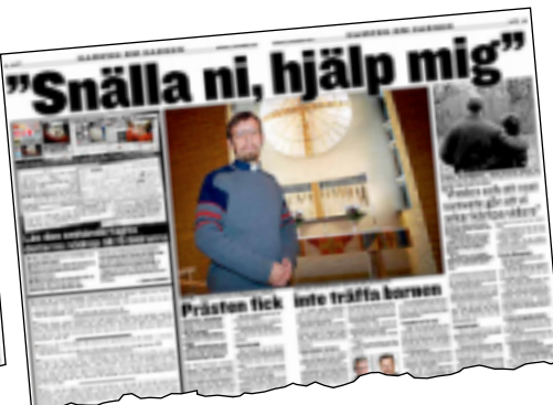
GT den 11 november.